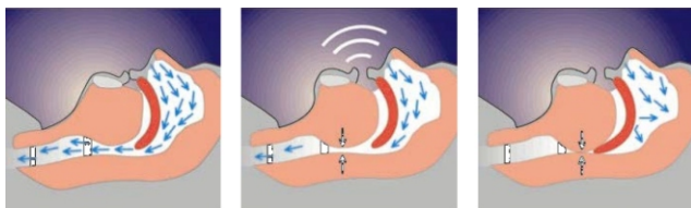
Interrupción del flujo respiratorio en la apnea obstructiva del sueño (AOS).

La apnea obstructiva del sueño (AOS) es la suspensión del flujo de aire durante el sueño, en la que se mantiene el esfuerzo respiratorio.