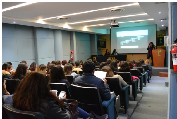
XXXV Coloquio del Programa de Residencia en Psicología Escolar

redes enfatizó la importancia de la evaluación cuantitativa y cualitativa, a través del portafolios, técnica que permite ir documentando los progresos de los participantes; 2) Uso de las tecnologías para promover la enseñanza y el aprendizaje. La comentarista, Dra. Benilde García, habló de desarrollar la alfabetización digital y que maestros y alumnos sean creadores de su propio conocimiento ya que las tecnologías por sí solas no hacen la diferencia; recomendó a las ponentes que “vayan con paso firme y pausado, con un ojo puesto en la teoría y otro en la práctica”; 3) Colaboración escuela-hogar , donde la