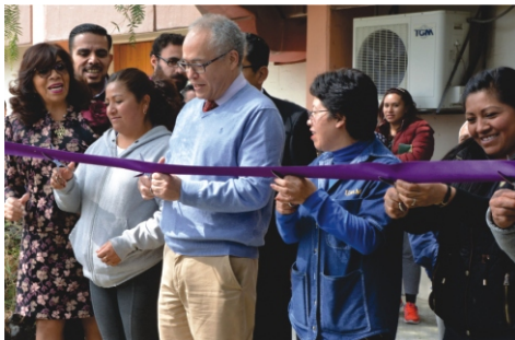
Inauguración de los vestidores del personal administrativo de intendencia.