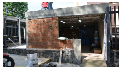
Archivo de Concentración

Centro Comunitario Dr. Julián McGregor, fueron rehabilitados, dignificando las acciones de formación y atención psicológica; se reubicó y amplió el área de resguardo del ciclero y se actualizó el equipo de audio del Auditorio Dr. Luis Lara Tapia. Para resguardar los documentos generados en la Facultad y cumplir con la normatividad en materia de transparencia y acceso a la información, se construye un nuevo Archivo de Concentración. ▀