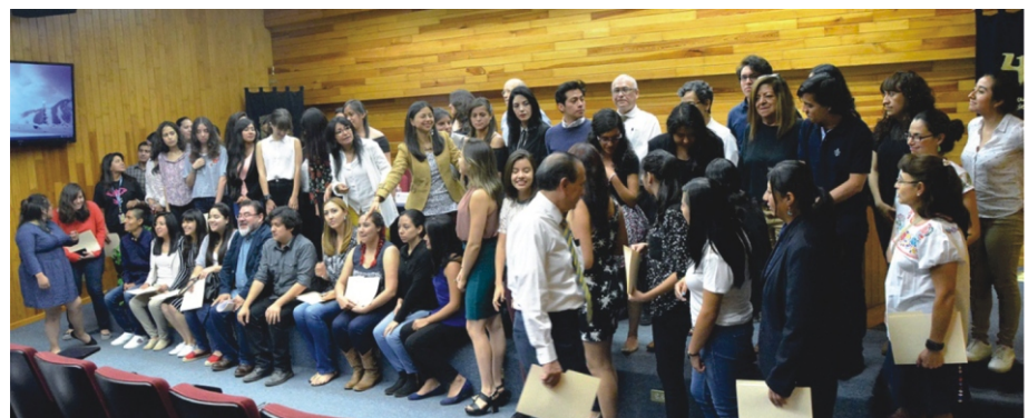
Organizadores, alumnos y académicos participantes en el Programa se reunieron para una foto al final del evento.

http://www.psicologia.unam.mx/programa-de-iniciacion-temprana-a-la-investigacion-en-psicologia/