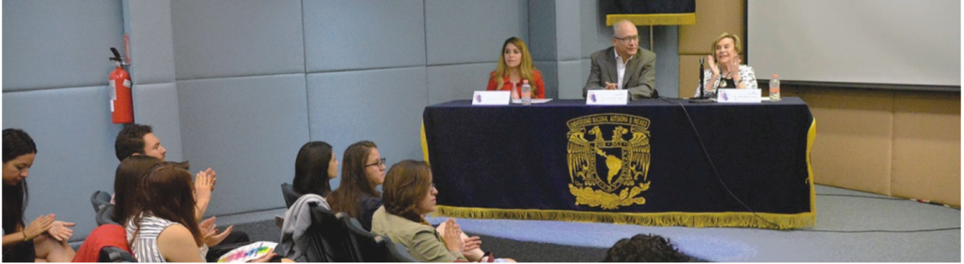
El presidium de la inauguración de las 9ª Jornadas Clínico-Académicas