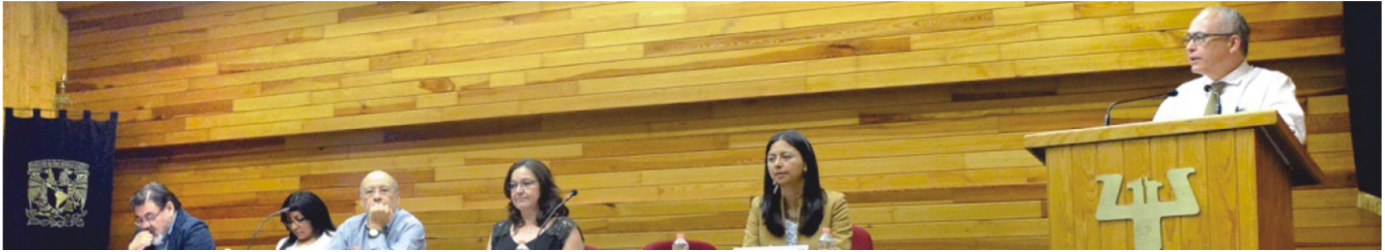
El presidium del evento escucha las palabras del director de la Facultad.