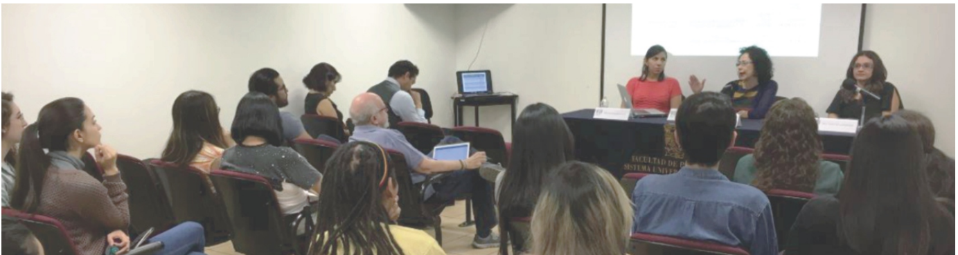
Profesoras del SUA durante su charla al auditorio