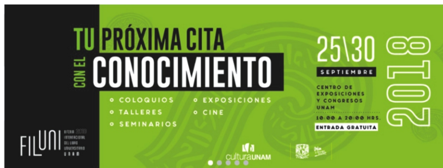
Fe de erratas. En la versión impresa salieron publicadas las fechas del año pasado.

compromete con apoyar la convivencia, la comprensión recíproca y la colaboración de actividades teóricas, prácticas y de cabildeo. Sus miembros se dedican tanto a la investigación básica y aplicada, así como a la práctica, y tienen vínculos con la formulación de políticas públicas. Psicólogos, arquitectos, geógrafos, diseñadores y planificadores, son algunas de las profesiones más representativas y IAPS sirve como una plataforma para la discusión y colaboración disciplinar a través de sus congresos y de sus reuniones regionales bianuales. ▀