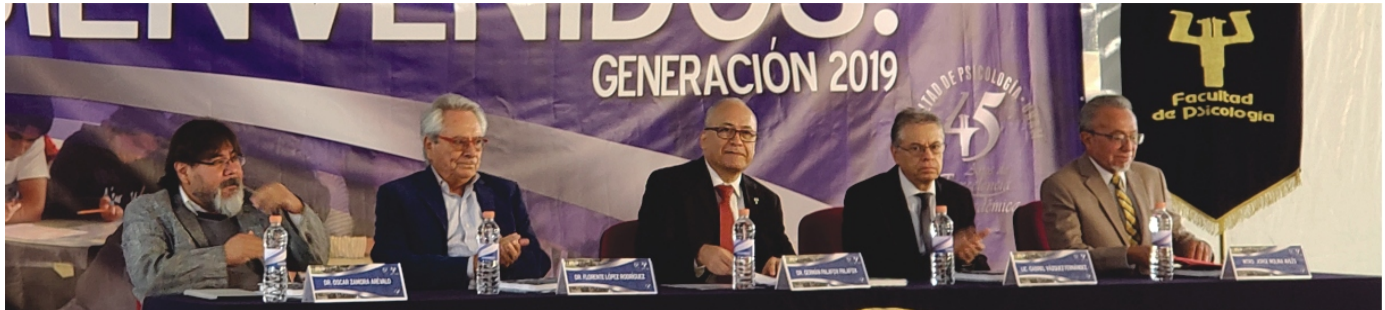
Los miembros del presidium de la Ceremonia de Bienvenida 2019.