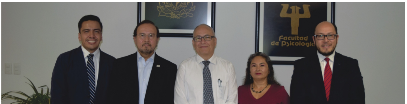
El director de nuestra Facultad posa con algunos integrantes de este proyecto.

El equipo coordinador del laboratorio, mediante invitación expresa, incluirá en su plan de trabajo propuestas que realicen otros investigadores para que puedan incorporarse y contribuir en las actividades del programa de trabajo que ya está en marcha. El Laboratorio de Psicometría y Evaluación se ubica en el cubículo 201 en el segundo piso del Edificio E del Posgrado. ▀