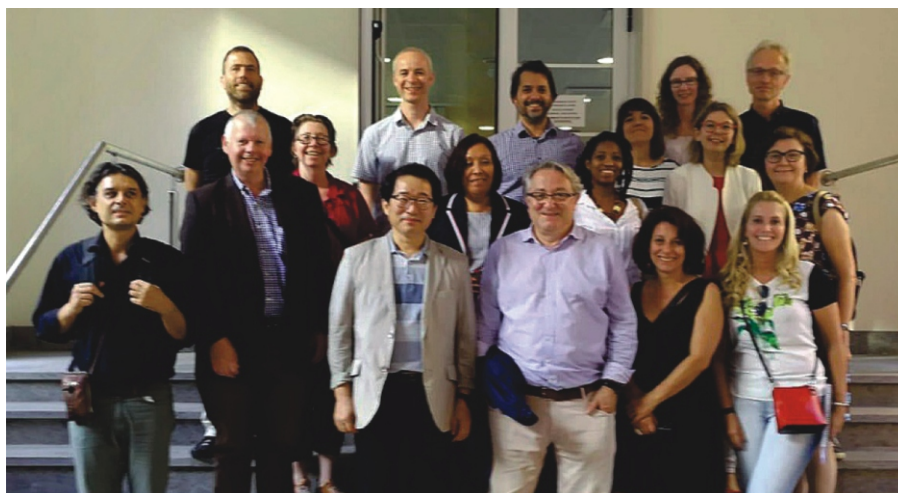
Miembros electos y salientes del Board of Directors de la IAPS, en Roma, Italia..