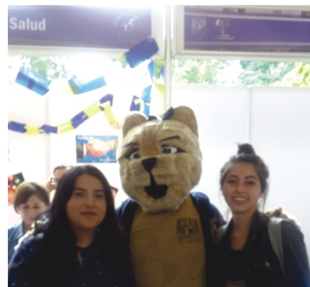
Alumnas posan junto a la pumita de la Facultad.

viar el sufrimiento humano e impulsar su desarrollo, eso interesa por igual. Alertó sobre la psicología intuitiva que manejamos todos, basada en experiencia personal, en concepciones heredadas, normas culturales y creencias tradicionales; aunque aporte saberes y ayude a delimitar lo que se quiere explicar, es fuente constante de errores, sesgos, prejuicios, ocurrencias y pseudo verdades, que se toman como buenas, sin razones o evidencias e, incluso, ante evidencia de su falsedad. Invitó a los alumnos a invertir los próximos cuatro años en una búsqueda del conocimiento psicológico, a leer y pensar críticamente, cuestionar tanto el sentido común como le evidencia basada en la autoridad, y a buscar, en su lugar, el conocimiento de una psicología basada en la mejor evidencia científica posible. Les pidió dos cosas; uno: exijan a los profesores, a todos en la Facultad, que demos lo mejor de nosotros mismos; y dos: exijanse ustedes mismos ese esfuerzo, a la par o mayor. Les ofreció un termómetro: si