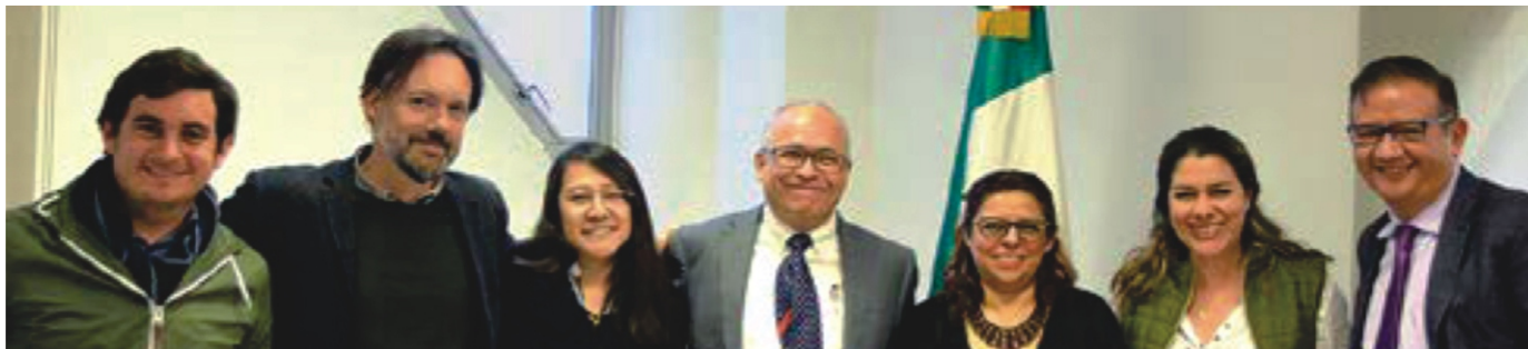
Los asistentes posan para la foto, tras la firma de las bases de colaboración