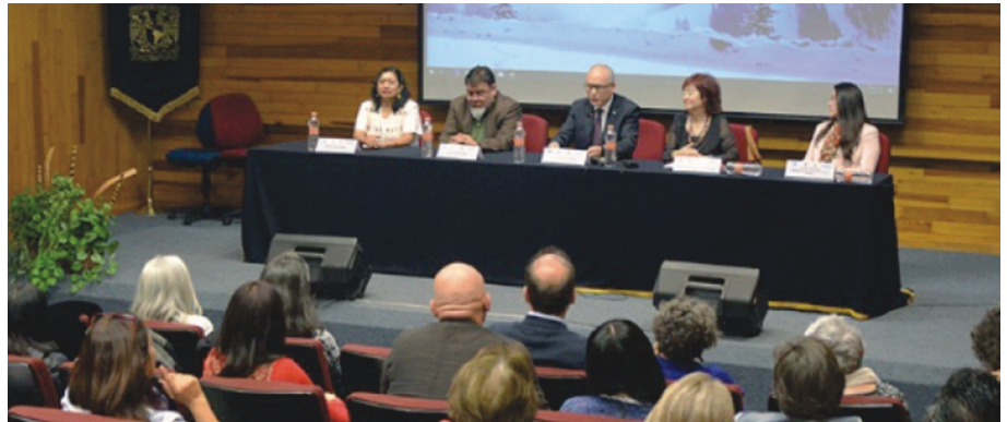
El público llenó el auditorio para atender a esta 9ª Jornada

dijo, está bien: una actitud crítica y racional ante los problemas, para encontrar soluciones apoyadas en la evidencia científica, que den certidumbre al hacer. Un buen diagnóstico es relevante, observó, como lo es dar con una verdadera solución. De allí la gran importancia de resolver los problemas asociados al maltrato creando condiciones para que se dé y se sostenga el buentrato. Éste, comentó, se confunde muchas veces con complacencia, con dejar hacer y, lejos de ello, es señal del respeto y expectativas de recorrer un camino juntos. La crítica que construye y alimenta al otro es parte de ese buentrato. Por ello hay que reconocer y apoyar las colaboraciones académicas que generan el conocimiento y aplicaciones para el desarrollo positivo de niños, niñas, y jóvenes, del ser humano en su totalidad. Hizo votos por continuar celebrando cada año una nueva de estas Jornadas.