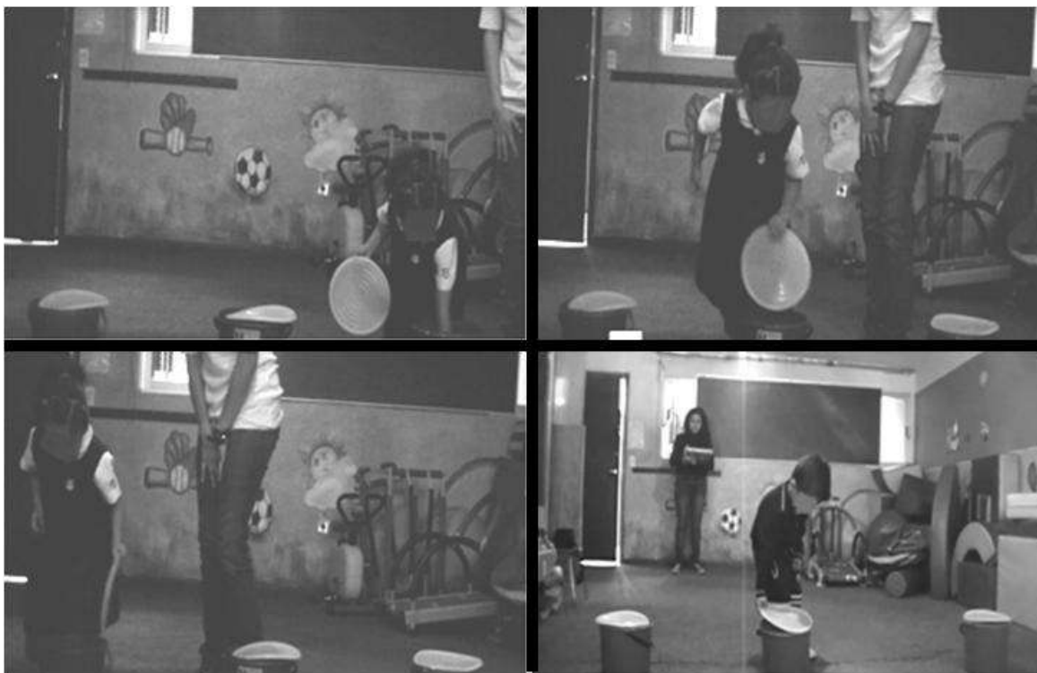
Figura 1. La figura muestra la tarea escondite/búsqueda en los ensayos de entrenamiento, en donde los niños buscaban en cada uno de los contenedores acompañados de la experimentadora, así como el ensayo de prueba en donde cada niño se dirigió solo a buscar en el contenedor de su preferencia.

dieran su respuesta se les pedía que contaran el contenido. A continuación se les pidió que taparan de nuevo el contenedor y se les llevo de la mano al siguiente contenedor. De ésta manera se visitaron los 3 contenedores (A, B y C), después se llevaba afuera del salón a los niños y daba inicio el siguiente ensayo. El orden de inicio de las visitas a los contenedores fue semialeatorio a lo largo de los 5 ensayos de cada fase. La fase de prueba se realizó en un ensayo en donde se les pidió a los niños que fueran desde la puerta de la habitación hacia los contenedores y destaparan aquel en donde se encontraban las calcomanías con las que quisieran quedarse. Una vez terminada la tarea se les obsequió a los niños una planilla de calcomanías. La figura 1 muestra imágenes de los niños realizando la tarea experimental