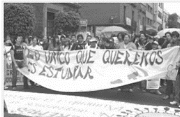
rechazados. En 2009 los alumnos que no fueron aceptados en la UNAM marcharon desde La Normal de Maestros hasta la SEP

Los inconformes afirmaban además haber sido víctimas de un proceso de selección injusto y poco confiable, mencionando que muchos de los rechazados habían obtenido mejores calificaciones en el nivel medio superior que quienes fueron aceptados. Argumentaron además que era posible conseguir los exámenes de admisión resueltos, por lo que algunos de los estudiantes aceptados estaban ahí por prácticas deshonestas, mientras que los rechazados habían hecho su mejor esfuerzo estudiando para su examen.